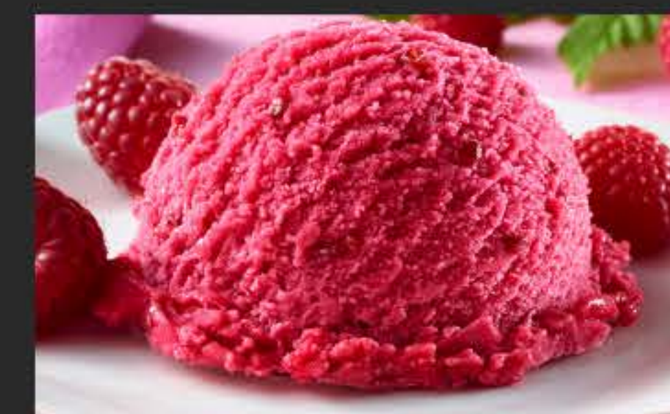
73994 Sorbet Himbeere 2 x 2,4 l-WAN