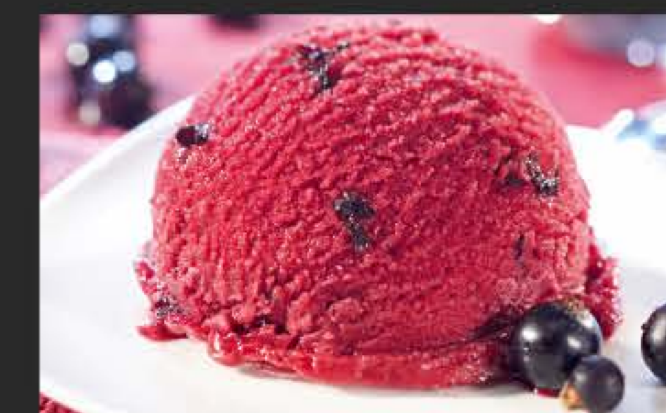
39250 Sorbet Cassis 2 x 2,4 l-WAN