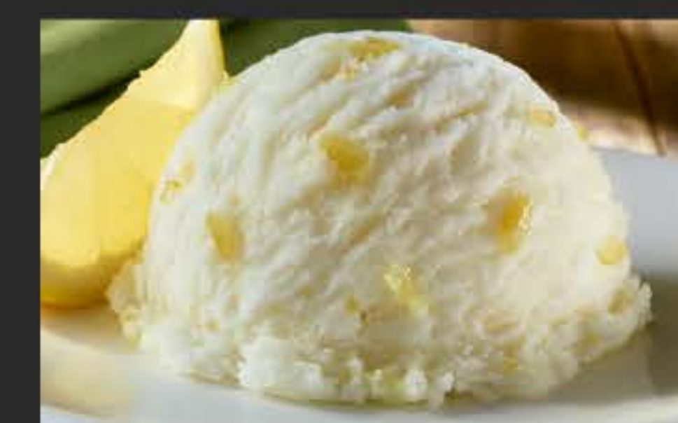
39807 Sorbet Zitrone 2 x 2,4 l-WAN