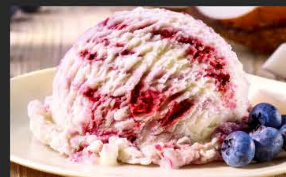
74054 Kokos-Blaubeere Vegan, 2 x 2,4 l-WAN