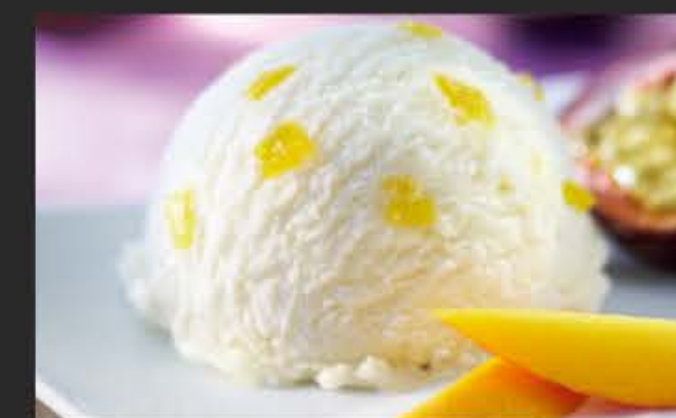
39809 Sorbet Passionsfrucht 2 x 2,4 l-WAN