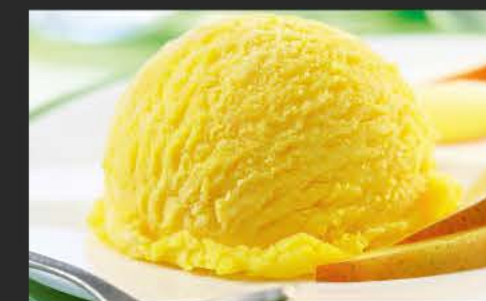
39805 Sorbet Mango 2 x 2,4 l-WAN