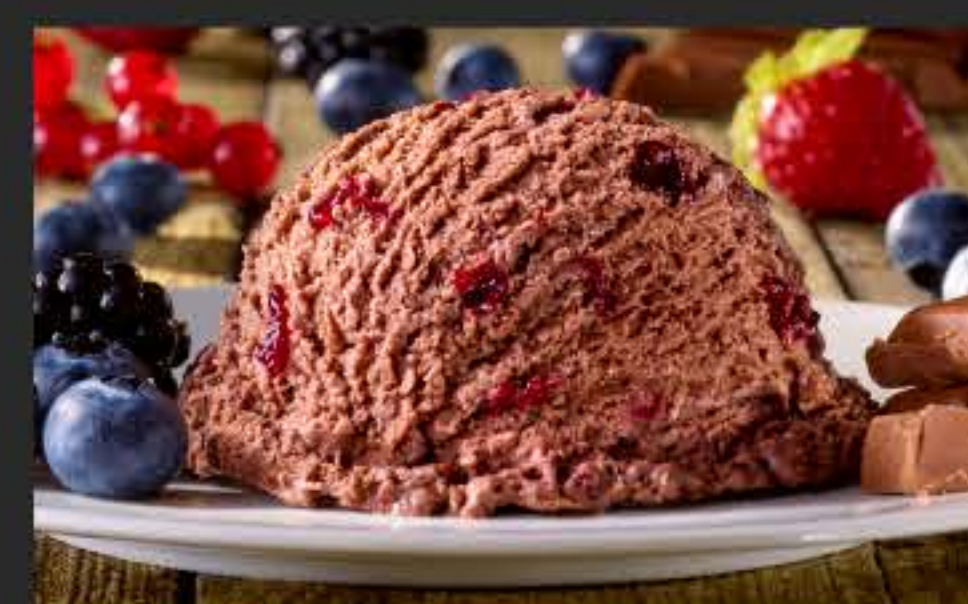
40544 Schoko-Waldfrucht Vegan, 2 x 2,4 l-WAN

Hoher Fruchtanteil, mit Fruchtstücken und intensiv im Geschmack