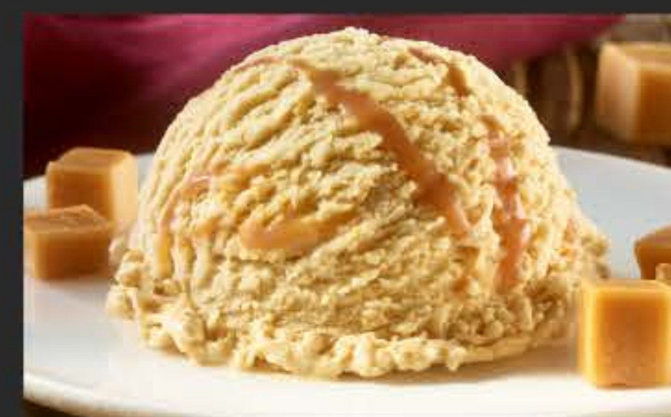
09148 Toffee Vegan, 5 l-WAN