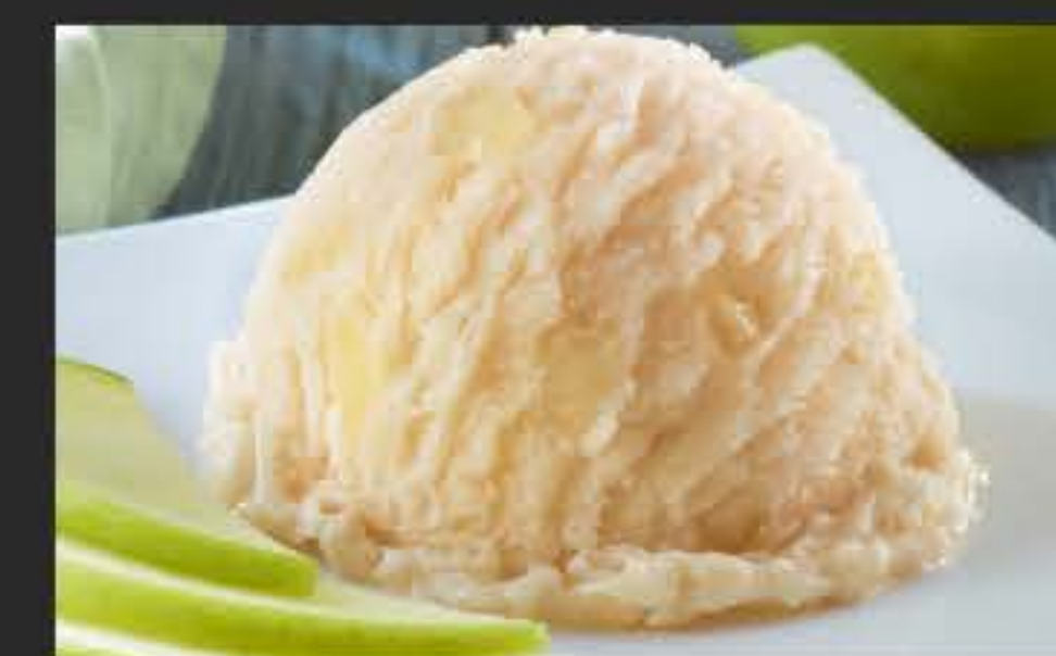
39811 Sorbet Apfel 2 x 2,4 l-WAN